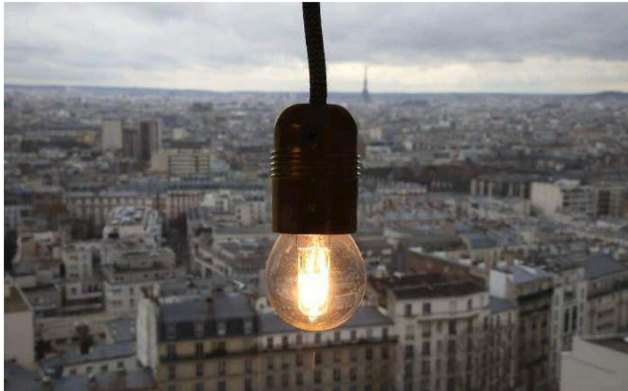
ekWateur, GreenYellow, Mint Énergie et Ovo Energy sont dans le collimateur de la CLCV, qui appelle les consommateurs à la plus grande vigilance.

Car même si le gouvernement a décidé de plafonner momentanément à 4 % la hausse du tarif réglementé de vente (TRV) prévue en février (qui était estimée initialement à 12 %), celle-ci influence mécaniquement les offres de marché proposées par les alternatifs. « Les consommateurs,